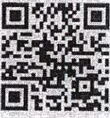
เกณฑ์ในการพิจารณาคัดเลือก

กลุ่มส่งเสริมกิจการการศึกษาและเครือข่าย โทร. ๐ ๒๒๘๒ ๑๒๘๓ โทรสาร ๐ ๒๒๘๒ ๒๘๕๘